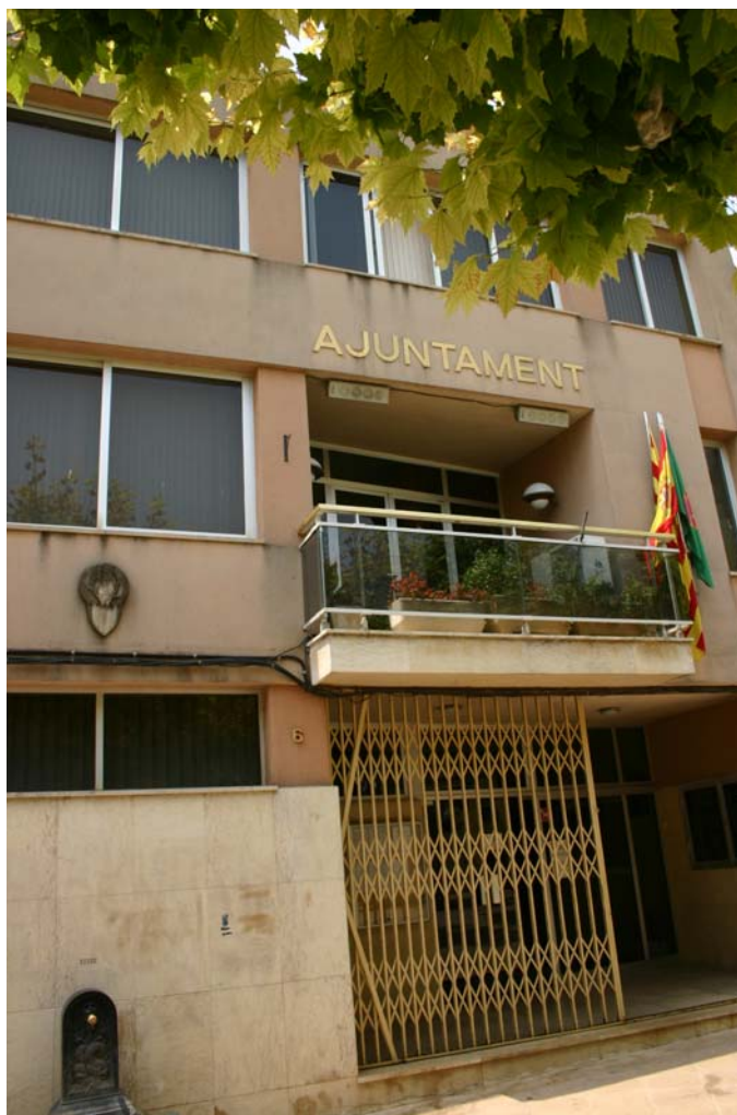
Foto nº37. Edifici de l'ajuntament de Banyeres del Penedès

Per últim, cal comptar dos algtzils, un de matí i un de tarda, que disposen de l'únic vehicle municipal, una furgoneta Nissan.